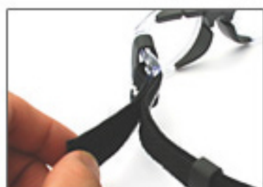
ベルクロ調整ベルト

ベルトの長さ調整はベルクロ式でお子様でも簡単に行えます。バックル等の硬質なパーツを使用していないため、安全性にも優れます。