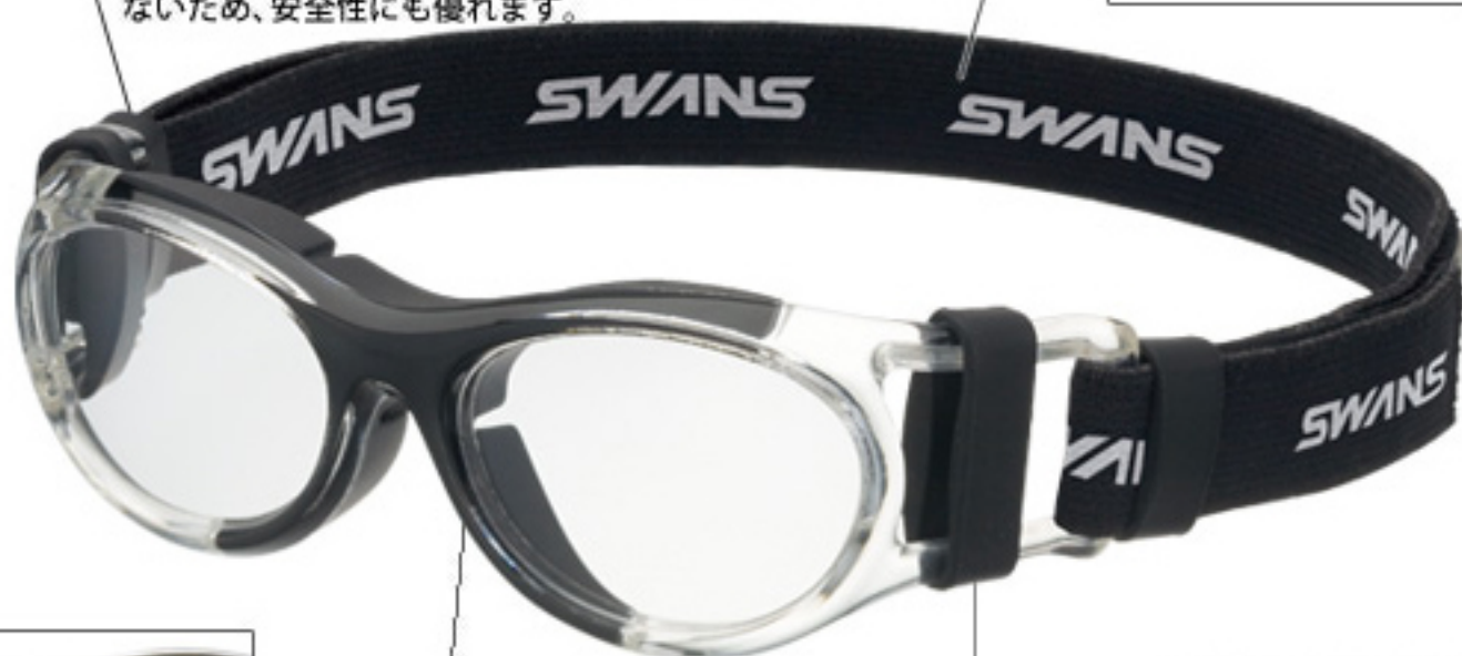
サイドクッションパーツ

程よい柔らかさのシリコン素材でフレームが直接頭部に当たることを防ぎます。外と内とで厚みが異なり、反転させることで各ユーザーに合ったフィッティングを実現します。